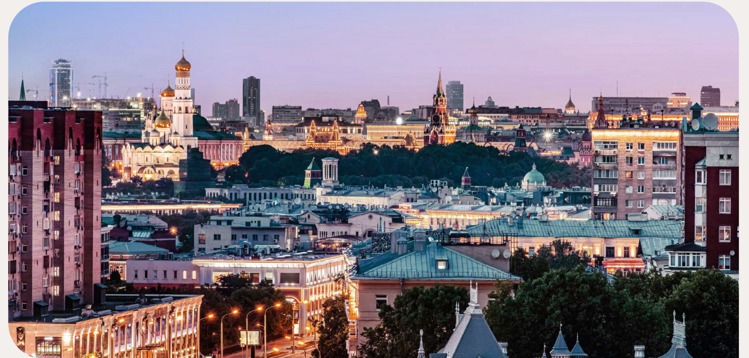
✦ ВИД НА КРЕМЛЬ