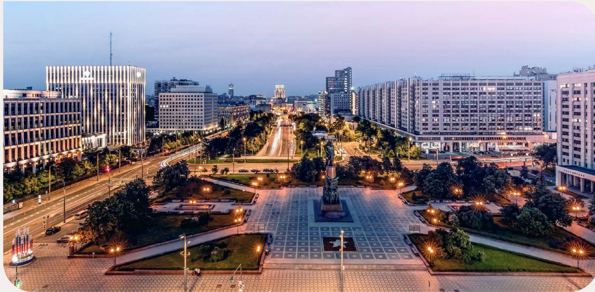
✦ ВИД НА КАЛУЖСКУЮ ПЛОЩАДЬ