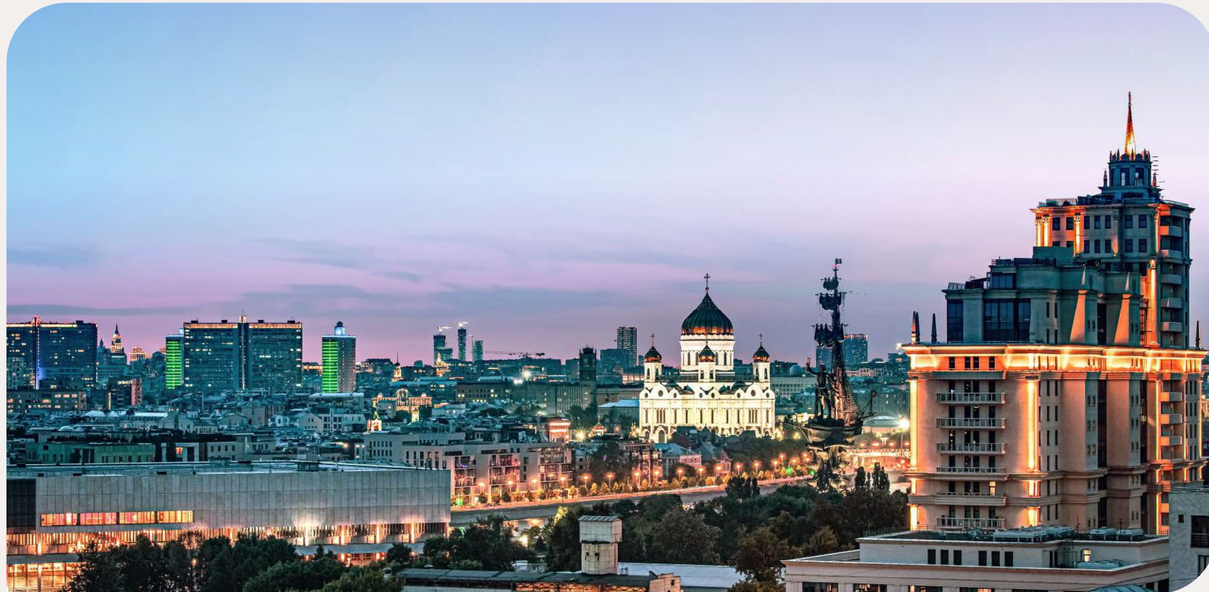
✦ ВИД НА ХРАМ ХРИСТА СПАСИТЕЛЯ